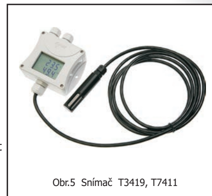
Obr.5 Snímač T3419, T7411

Další příslušenství - viz dále v katalogu