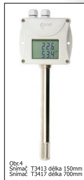
Obr.4 Snímač T3413 délka 150mm Snímač T3417 délka 700mm