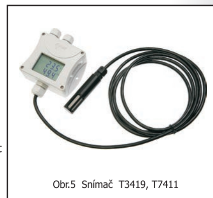
Obr.5 Snímač T3419, T7411

Další příslušenství - viz dále v katalogu