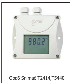
Obr.6 Snímač T2414, T5440