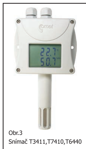
Obr.3 Snímač T3411, T7410, T6440