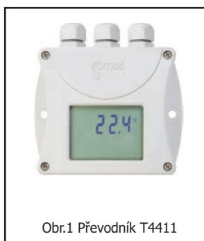
Obr.1 Převodník T4411

1) Maximální teplota platí pouze pro měřicí konec s čidly. Při teplotách nad +85°C nesmí relativní vlhkost v trvalém provozu překročit povolenou mez dle grafu dále v katalogu. V okolí plastové hlavice je maximální povolená teplota +80°C.