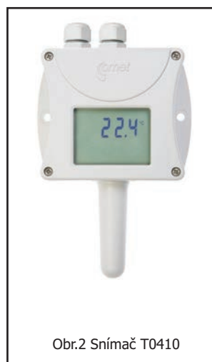
Obr.2 Snímač T0410