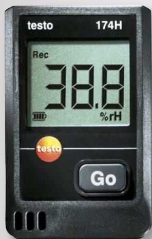
Obrázek: skutečná velikost